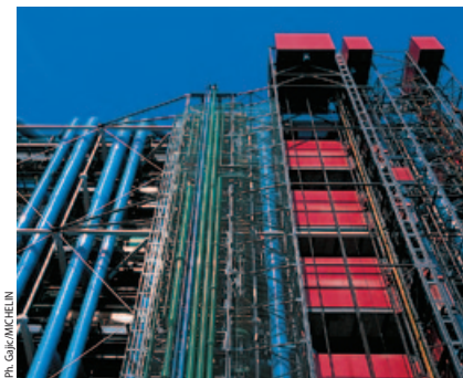
Różne przeznaczenie – różne barwy: zielony to kolor instalacji wodnych, biały – przewodów wentylacyjnych, błękitny – klimatyzacji, żółty – instalacji elektrycznych, czerwony – klatek schodowych i korytarzy

Podobnie jak w dawnych świątyniach część murów kościoła zasłaniają przylegające doń domy. We wnętrzu utrzymanym w stylu płomienistym zachowały się piękne