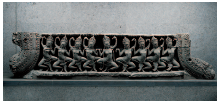
Dziewięć tańczących apsaras (Kambodża, epoka angkorska)