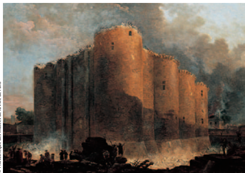
H. Robert, Bastylia w pierwszych miesiącach rozbiórki

Słynne więzienie. Król Karol V postanowił wznieść tu zamek St-Antoine, który paryżanie nazwali później Bastylią – od podmokłego, niezbyt zachęcającego terenu, na którym stanął. Pierwszy kamień pod budowę położono w 1370 r. Historia fortecy nie ma w sobie nic heroicznego: oblegana siedem razy w czasie wojen domowych, sześć razy poddawała się bez walki... W Bastylii był więziony – i zmarł w 1703 r. – tajemniczy człowiek zwany „Żelazną Maską”, którego legenda podaje za brata bliźniaka Ludwika XIV.