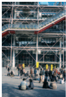
Ruchome schody Centrum Pompidou zwane „gąsienicą”

Trasa kończy się przy rzeźbach Brancusiego (wielkiego prekursora współczesnej rzeźby, z pochodzenia Rumuna, który w Paryżu mieszkał od 1904 r. do śmierci w 1957 r.) i olbrzymim wycinanym dziele Matisse'a Smutek króla ( La Tristesse du roi ).